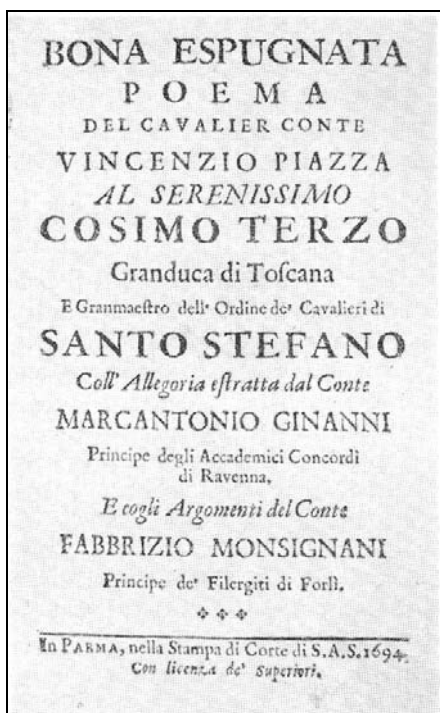
(fig. 3) Frontespizio della 1.a edizione di «Bona Espugnata» del 1694.